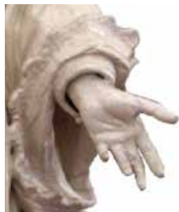
Kulturinformation: Hl. Aloisius, barocke Statue