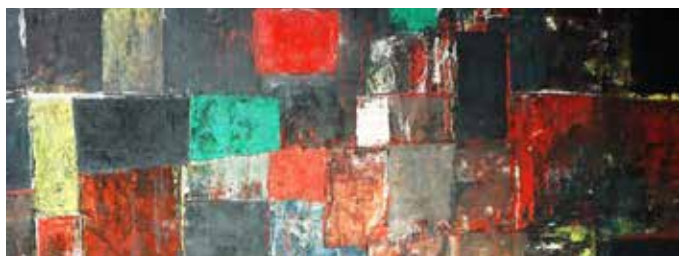
Qualitätsspender: Abstrakte Komposition (Kreuzbild)