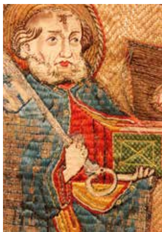
Glücksfund: Hl. Petrus, gotisches Messkleid

90 Dinge – bekannt oder ungewöhnlich, Kunstwerke und Alltagsware – laden zum Hinsehen, Betrachten, Staunen, Fragen und Hinterfragen ein.